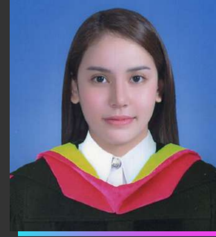
เกียรตินิยมอันดับ 2 เมษญา ปวงรรินทร์