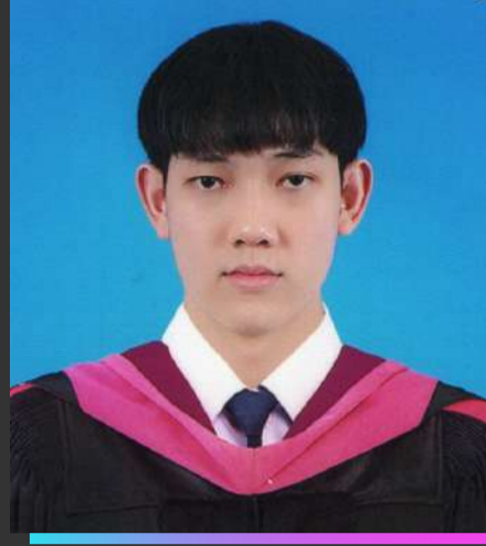
รัฐศาสตร์ แสงคำมา