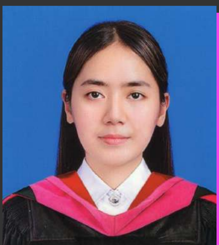
ฟ้านทร จันทรเมือง