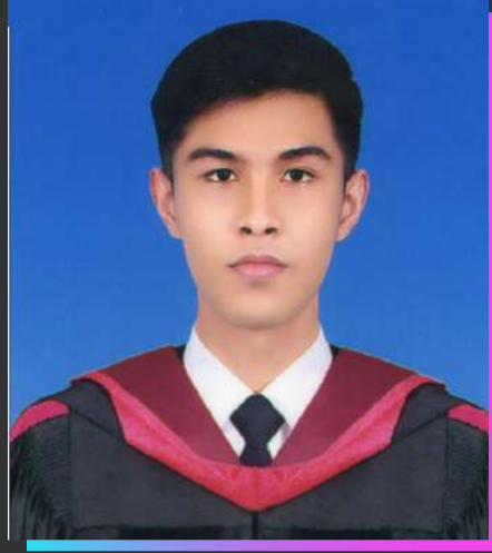
ยุทธศาสตร์ หลังยาน่าย